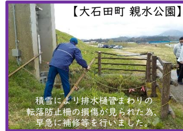
積雪により排水樋管まわりの転落防止柵の損傷が見られた為、早急に補修等を行いました。