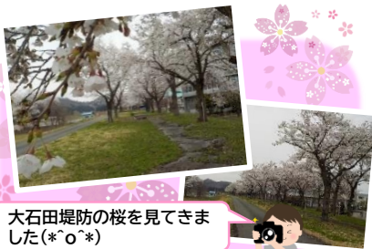
大石田堤防の桜を見てきました(*o*)