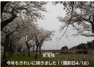
今年もきれいに咲きました！(撮影日4/18)