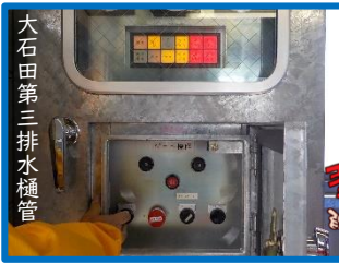
大石田第三排水樋管