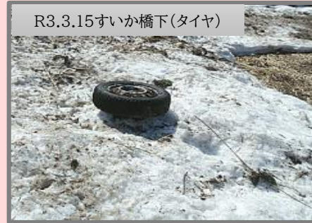
R3.3.15すいか橋下(タイヤ)