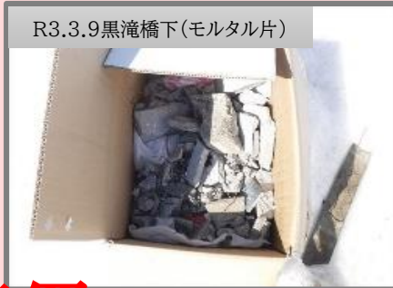
R3.3.9黒滝橋下(モルタル片)