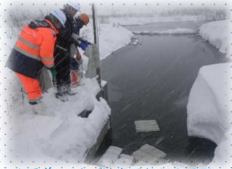
▲吸着マットで油を回収(12/27)