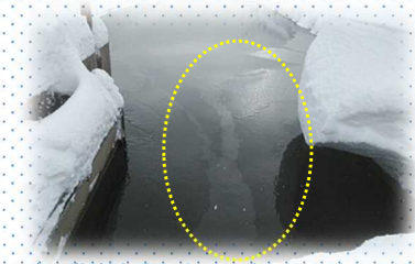
▲岩ヶ袋消流雪取水口に流れ込む油(12/27)

消防署・警察署・市町村役場・県の各総合支庁・国土交通省 へ速やかに連絡をお願いします。