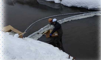
▲横山第四排水主管にオイルフェンスを緊急設置(1/15) ▲オイル試験紙による水質確認(1/18)

油回収に係る費用は原因者の負担となり、実際に請求しています。くれぐれも油の取り扱いにはご注意ください!!