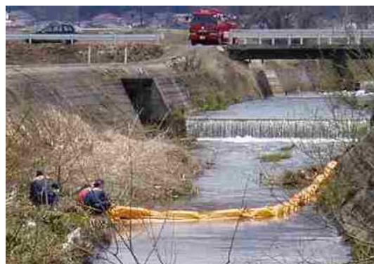
村山消防本部によるオイルフェンス設置の様子

出張所では、沢の目川と最上川の合流点にてフェンス設置の待機をし、河川巡視を行いました。最上川への影響は確認されませんでした。