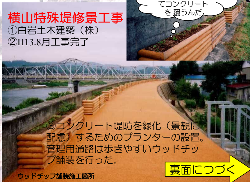
ウッドチップ舗装施工箇所