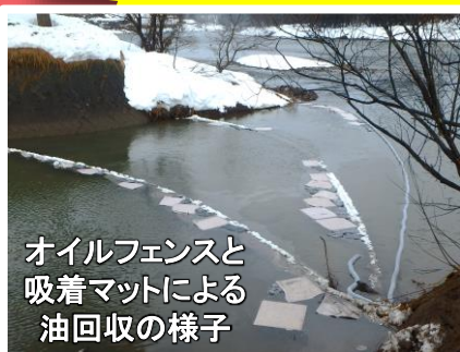
オイルフェンスと吸着マットによる油回収の様子

近年、最上川水系の水質事故件数が東北地方の1級河川12水系の中で連続ワースト1となっています。水質事故の7割以上が油流出事故です!!