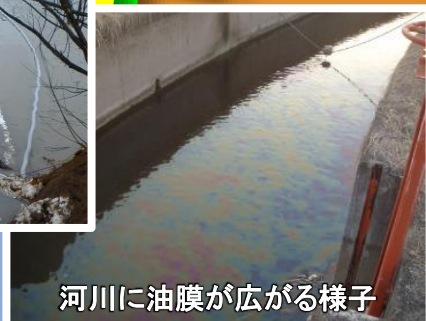
河川に油膜が広がる様子