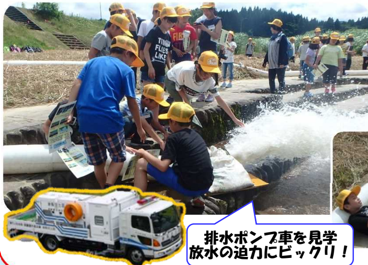
排水ポンプ車を見学 放水の迫りにビックリ！