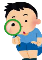
透視度計で川の水の透明度を見てみよう！