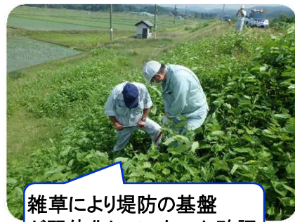
雑草により堤防の基盤が弱体化していないか確認