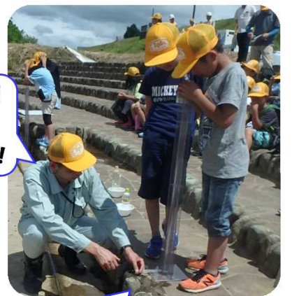
最上川は「まあまあきれい」だね