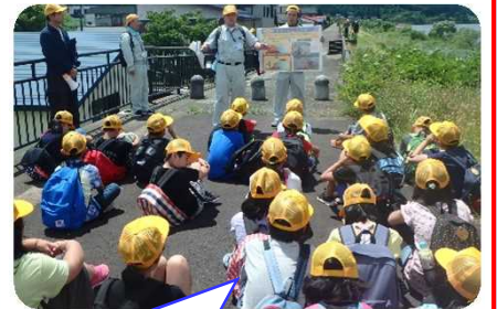
堤防の種類や役割を勉強