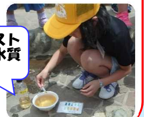
パケットを使って水質調査