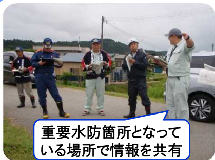
重要水防箇所となっている場所で情報を共有