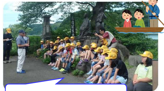
最上川にまつわる歴史を勉強