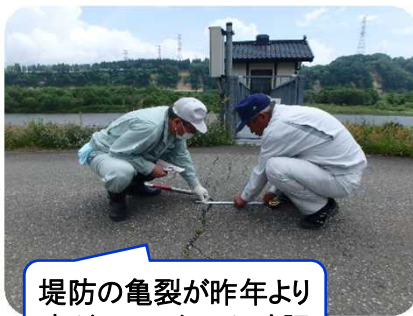
堤防の亀裂が昨年より広がっていないか確認

5月16日、23日、6月6日 最上川の堤防が本来の機能を維持できているか、管内全ての堤防を歩き、細部まで点検を実施しました。点検の結果、早急に補修を必要とする箇所はありませんでした。