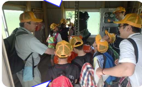
排水樋管の操作を体験