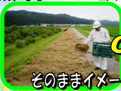
そのままイメージ

鳥越出張所では、毎年堤防管理のため除草を行っております。その際にでた刈草を地域の方々に無償でお譲りする取り組みを実施しております。刈草を堆肥の原料、家畜の飼料等に使用してみたいかたがでしょうか!?