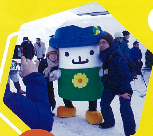
月山朝日観光協会 イメージキャラクター 『ガッさん』

開催中止の確認はFacebook、公式ページ、ラジオ、月山朝日観光協会にお問い合わせください。