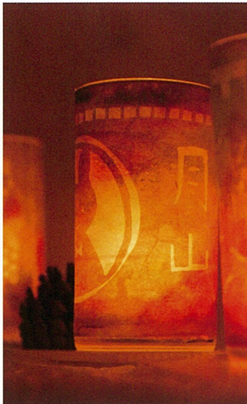
月山和紙を使った作品の展示▶

月山志津温泉では、四季を通して旬の素材を使用した「月山四季の膳」をご用意しております。雪旅籠の灯りが開催されるこの期間は各宿で「雪旅籠御膳」をお召し上がりいただけます。(要予約)