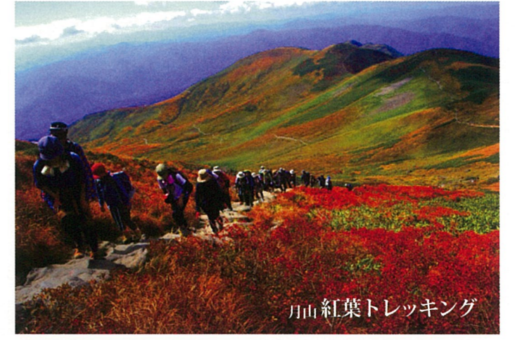
月山紅葉トレッキング