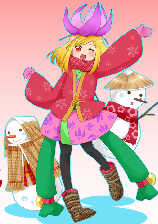
あさひむら観光協会 イメージキャラクター「カタク 姫」