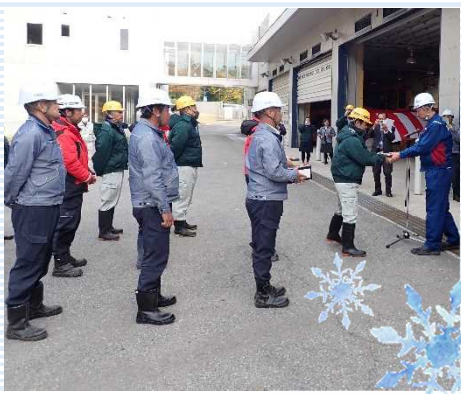
▲米沢国道維持出張所長から維持業者へ除雪機械の鍵が引き渡されました。