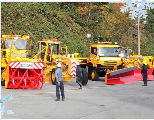
▲オペレータが除雪機械の点検を行い、異常がないことを出張所長に報告しました。