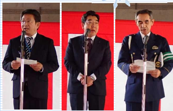
▲左から山形河川国道事務所副所長、米沢市長、米沢警察署長(代理)よりご挨拶いただきました。

▼除雪現場の第一線で永年にわたり除雪作業に従事し、冬期道路交通の確保に貢献された方々に対し、除雪従事功労者の表彰を行いました。