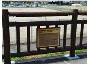
完成記念プレート