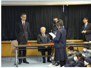
生徒代表からのお礼