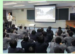
防護柵の製作過程説明