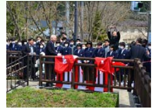
完成記念プレート除幕式