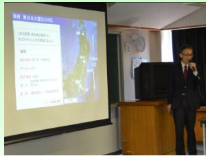
手塚事務所長特別講話