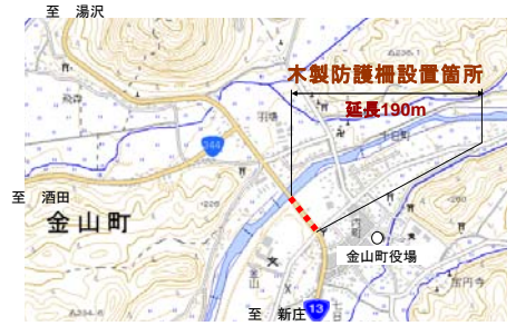
国道13号 金山町金山地区

完成を記念して、平成25年5月10日に完成式典を開催しました。式典では、通学路となっている金山中学校の生徒たちに参加していただき、「進路学習」の一環として山形河川国道事務所長による特別講話「国土交通省の仕事について」も実施しました。