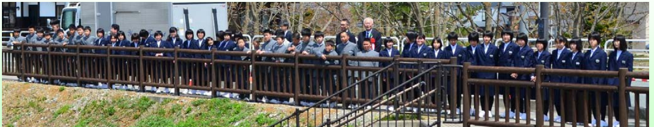
金山中1学年の皆さんとの記念撮影