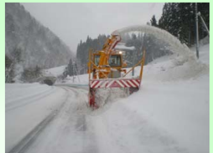
ロータリ除雪車 雪を路外に飛ばし道幅を確保します