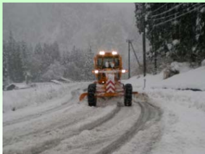
除雪グレーダ 路面にできた圧雪を排除します