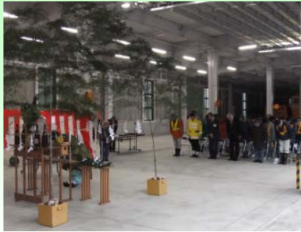
除雪業者さんが今冬の無事故無災害を祈願しました