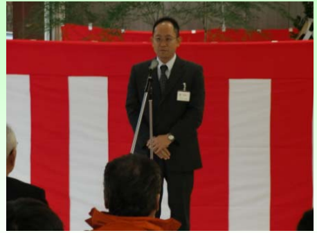
前内山形河川国道事務所長より激励の挨拶がありました