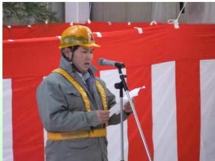
除雪業者の代表者が安全に除雪作業を行うことを宣言しました