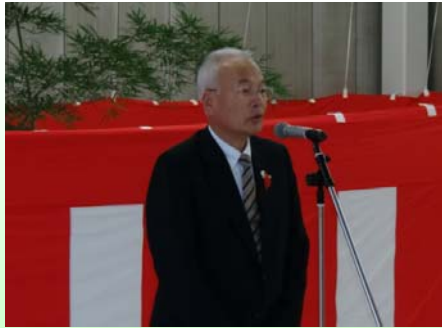
金山町長 鈴木洋様よりご挨拶を頂戴しました