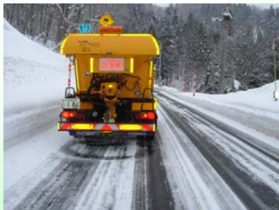
凍結抑制剤散布車 カーブや坂道等に凍結抑制剤を散布します