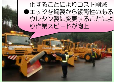
除雪機械のエンジン始動！ 来春までの長丁場をフル稼働します