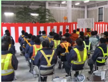
式典には関係者約50名が参列しました