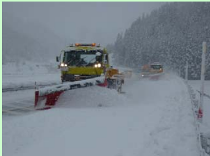
除雪トラック 路面の雪を迅速に排除します

除雪作業時に活躍する除雪機械をご紹介します。様々な種類がありそれぞれに役割があります。