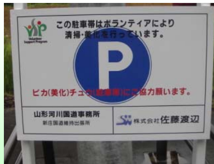
サインボードの拡大写真