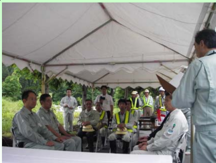
協定締結式には約20名が参加しました