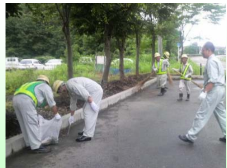
締結式終了後に参加者全員で駐車帯の清掃を行いました

ボランティア・サポート・プログラムの協定を締結してのボランティア活動は、最上地方では(株) 佐藤渡辺金山営業所が初めてとなります。