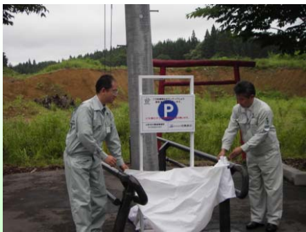
サインボードの除幕式を行いました