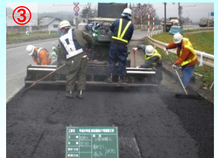
③ 深い所まで亀裂が入っている箇所は下の層から舗装し直します