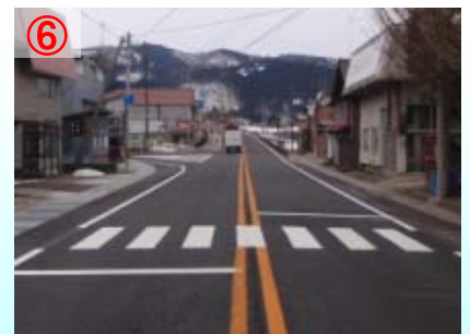
⑥ 補修後 走行が快適になるほか、周辺への騒音・振動も減少します