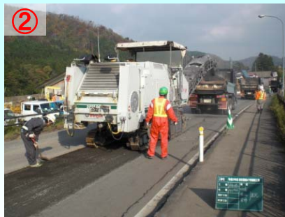
② 切削機械で傷んだ路面のアスファルト層を削り取ります