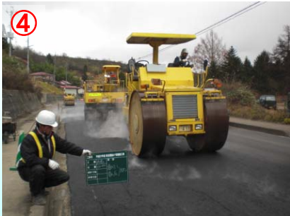
④ 新しいアスファルト合材を敷き詰め、ローラー車で締め固めます