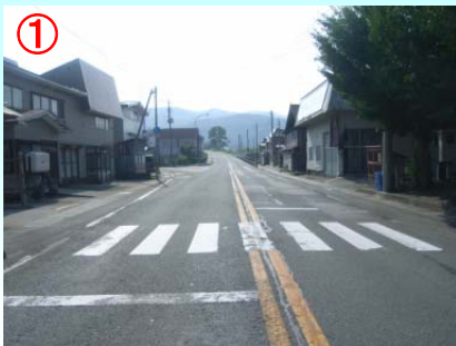
① 補修前 小さなでこぼこや亀裂などで路面が傷んでいました