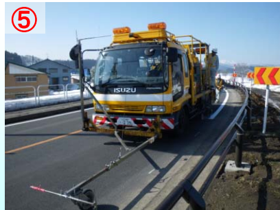
⑤ 新しいアスファルト層の上に区画線を引き直します