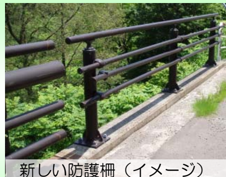
新しい防護柵(イメージ)