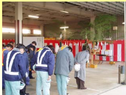
除雪業者さんが今冬の無事故無災害を祈願しました