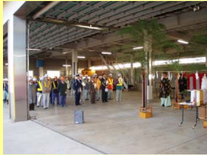
式典には関係者約40名が参列しました