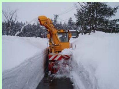
小型除雪車 通学路等において歩道を確保します