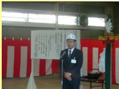
前内山形河川国道事務所長より激励の挨拶がありました