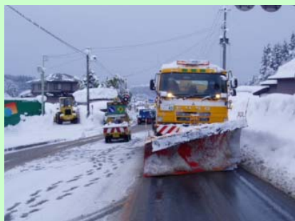
除雪トラック 路面の雪を迅速に排除します

除雪作業時に活躍する除雪機械をご紹介します。様々な種類がありそれぞれに役割があります。