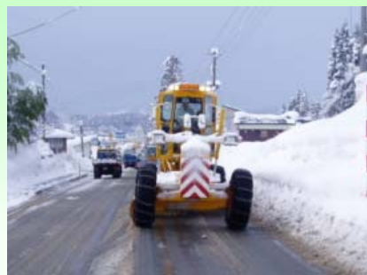
除雪グレーダ 路面にできた圧雪を排除します