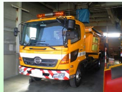
凍結抑制剤散布車 カーブや坂道等に薬剤を散布します