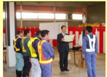
除雪現場の第一線で活躍された方々に表彰状を送りました