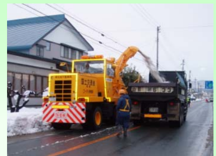
ロータリ除雪車 雪を路外に飛ばし道幅を確保します