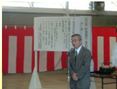
新庄市教育長武田一夫様よりご挨拶を頂戴しました