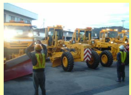
除雪機械のエンジン始動！ 来春までの長丁場をフル稼働します