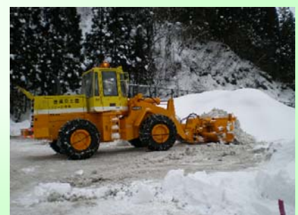
除雪ドーザ 交差点等の除雪を行います

今冬も安全で円滑な雪道の交通確保に努めてまいりますので、ご理解とご協力をお願いします。