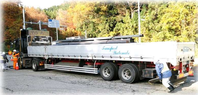
重量のほか、車体の長さ、幅、高さを計測