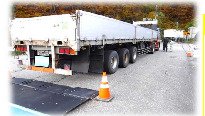
車検証・通行許可書の確認も行います