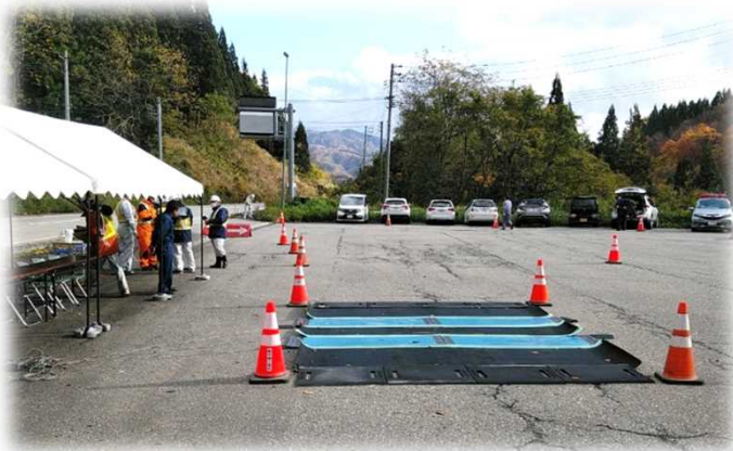
重量を量るマットスケール

11月12日(火)に国道47号 舟形町長尾トンネル駐車帯において、新庄警察署の協力の下、山形運輸支局と合同で特殊車両の取締を行いました。 なお併せて、総務省(不法無線)、山形県(不正軽油)の取締も行われました。