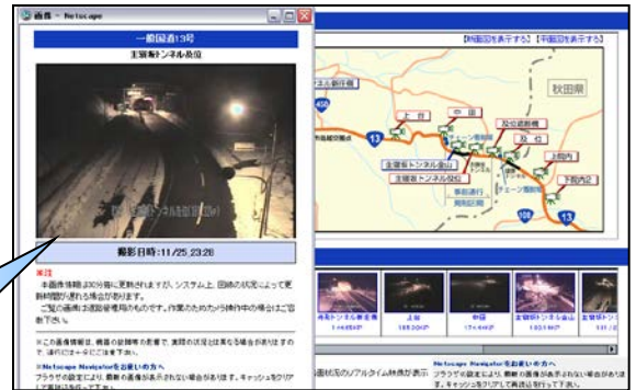
山形河川国道事務所HP 道路のライブカメラを選択