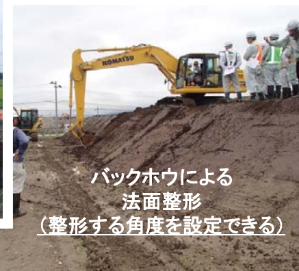
バックホウによる 法面整形 (整形する角度を設定できる)