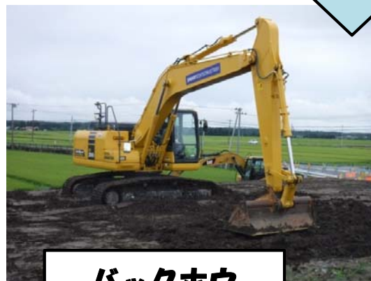
バックホウ (油圧ショベル)

施工に必要なデータを一元で保管・管理し、出来高の算出や面的な施工管理に活用できます。