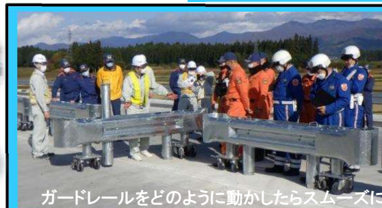
ガードレールをどのように動かしたらスムーズに通れるかを確認しました。