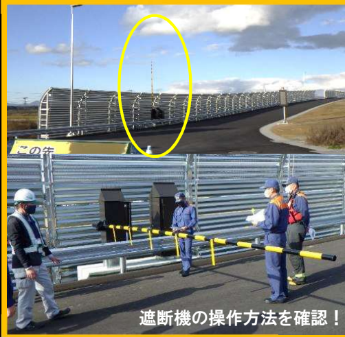
遮断機の操作方法を確認!

新庄鮭川ICの上り線、下り線の入口には遮断機が設置してあり、緊急時には進入できないようになります。