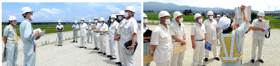
工事概要説明の様子。(仮)新庄北IC、泉田川橋付近で降車し、説明を行いました。