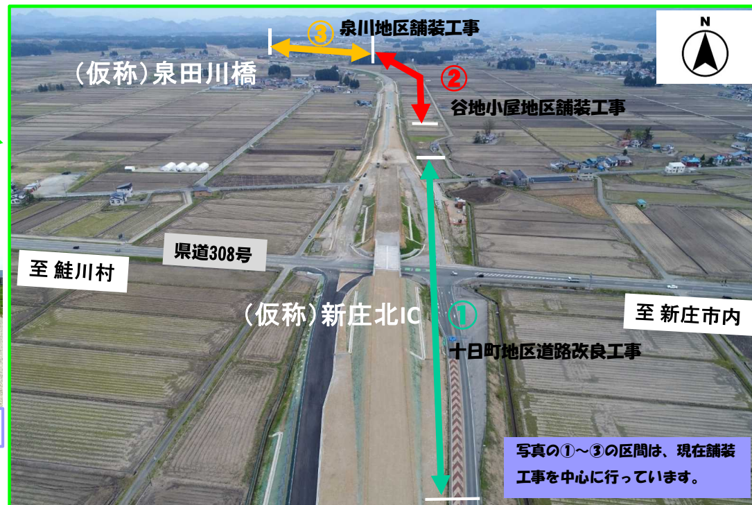
写真の①~③の区間は、現在舗装工事を中心に行っています。