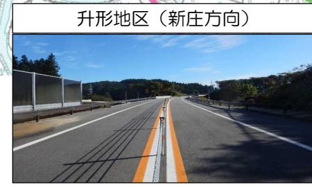
升形地区 (新庄方向)