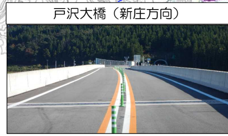
戸沢大橋 (新庄方向)