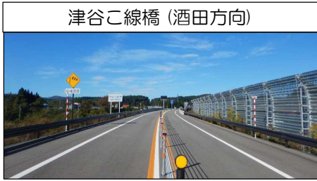
津谷こ線橋 (酒田方向)