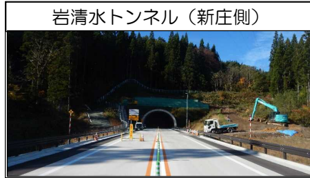
岩清水トンネル (新庄側)