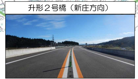
升形2号橋 (新庄方向)