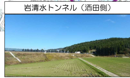
岩清水トンネル (酒田側)