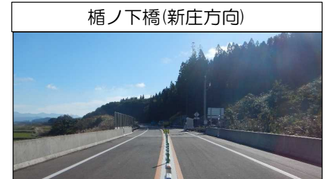
楯ノ下橋(新庄方向)