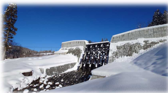
水沢第2砂防堰堤 ※未除雪