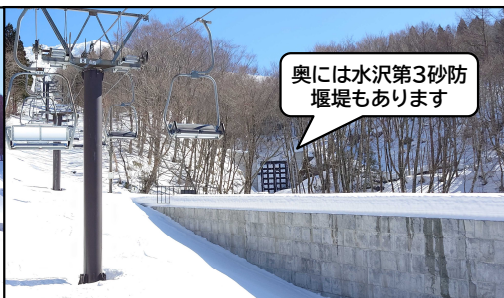
奥には水沢第3砂防堰堤もあります