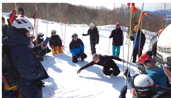
プローブ棒による捜索(ラインプロービング)の説明