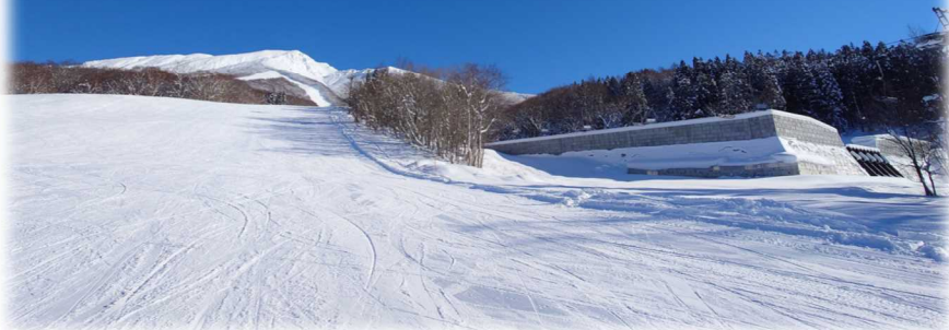
たざわ湖スキー場から望む冬の秋田駒ヶ岳と水沢第2砂防堰堤

スキーシーズン中は水沢リフトから堰堤を間近で観察できますので、ぜひその迫力を実感してください。