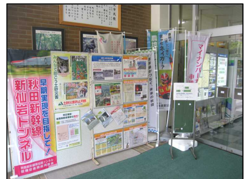
仙北市役所田沢湖庁舎(正面入口)