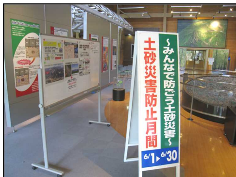
アルパこまくさ入口(看板の設置)

当出張所では、6月の土砂災害防止月間期間中に仙北市役所田沢湖庁舎正面入口及び田沢湖観光情報センター「フォレイク」(JR田沢湖駅構内)にて、過去に仙北市田沢湖で発生した土砂災害及び火山噴火等に関するパネルを6月30日まで展示しています。お近くをお通りの際は、ぜひご覧ください。