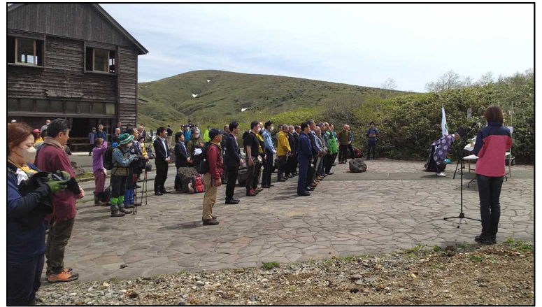
当日は多くの参加者で賑わいました