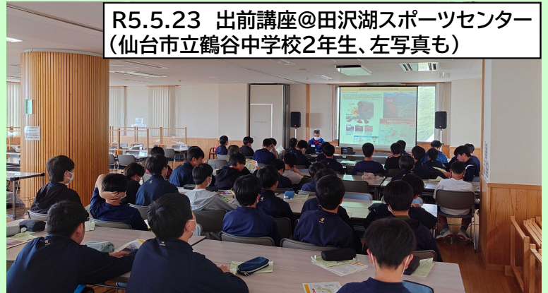
R5.5.23 出前講座@田沢湖スポーツセンター (仙台市立鶴谷中学校2年生、左写真も)