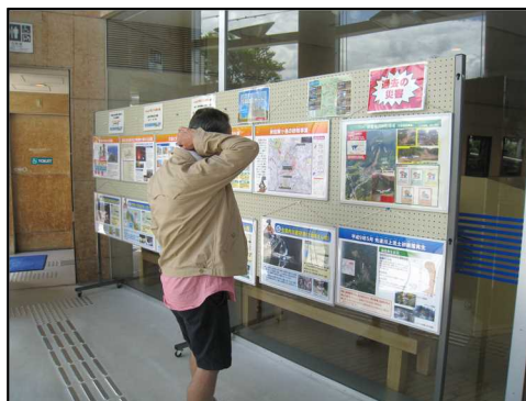
田沢湖駅(フォレイク前)