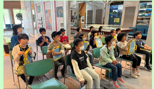
R5.5.18 アルパこまくさ見学 (仙北市立白岩小学校3・4年生)

★湯沢河川国道事務所 ☎0183(73)3174 https://www.thr.mlit.go.jp/yuzawa/index.html (トップページ→「ちいきづくり」→「お申し込みはこちら」)