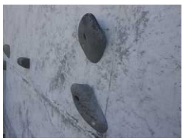
自然石のホールド:石のかたちで難易度を変えています