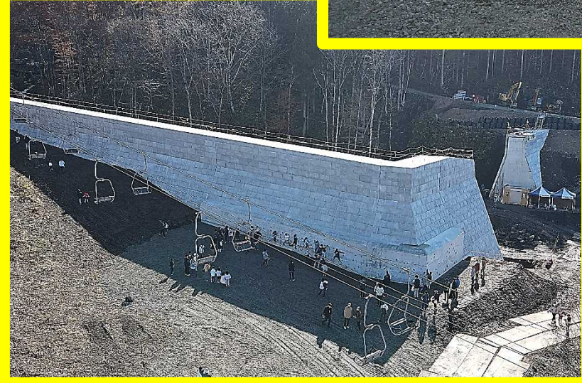
砂防ダム完成イメージ(工事中)