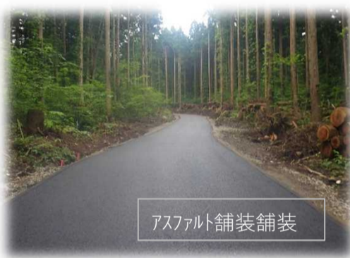
アスファルト舗装舗装