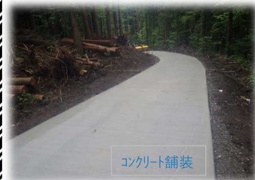
コンクリート舗装