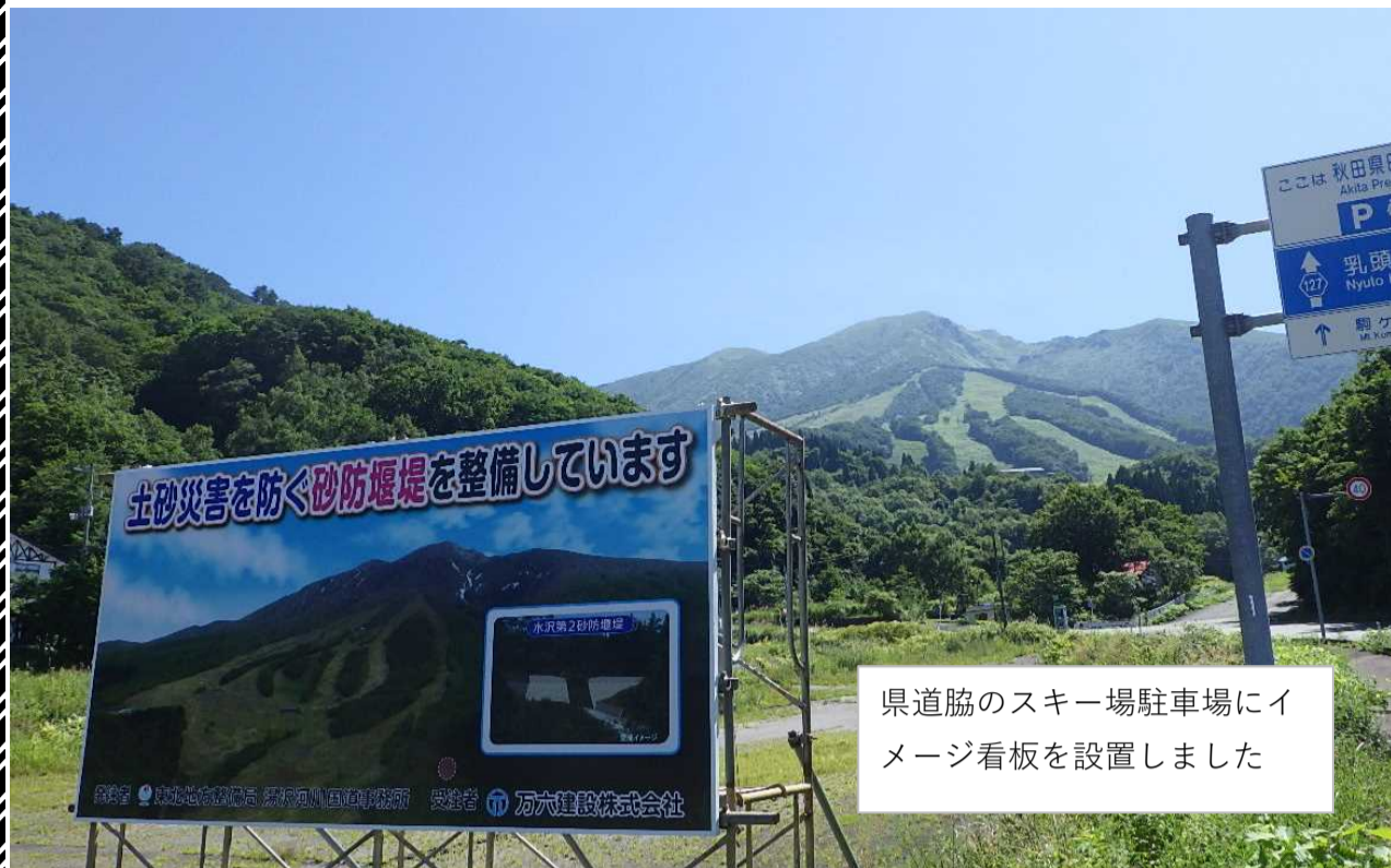
県道脇のスキー場駐車場にイメージ看板を設置しました