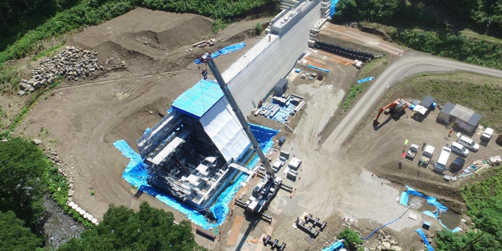
スリット組立状況 R5.7.24撮影