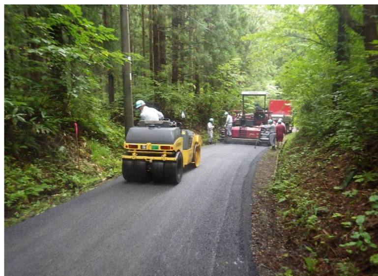
● 舗装施工状況。道路幅が狭く全面通行止めて作業しました。御協力ありがとうございました。