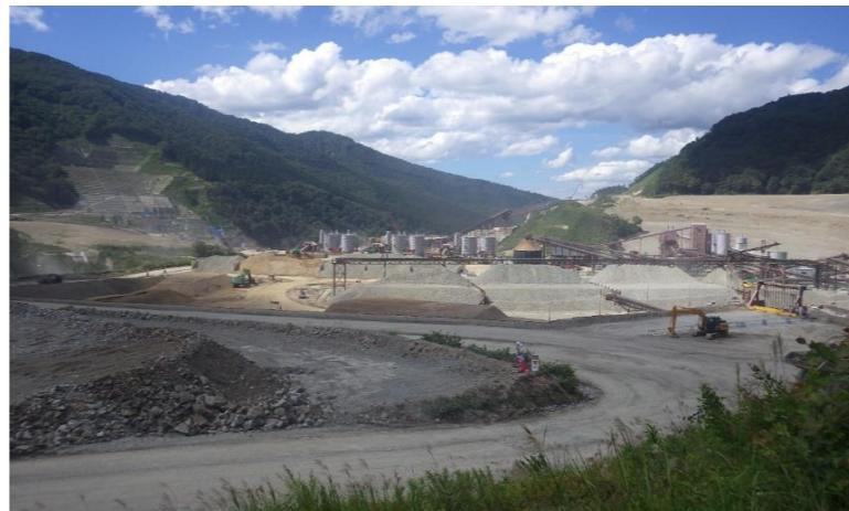
● 成瀬ダム展望駐車場からの現場風景です。とにかく広い!!