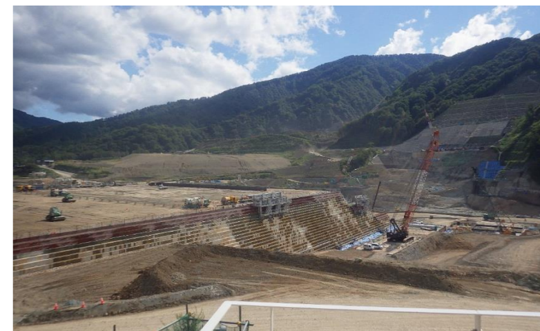
● KAJIMA DX LABO展望台からの現場風景です。すぐ目の前で工事が行われていました。