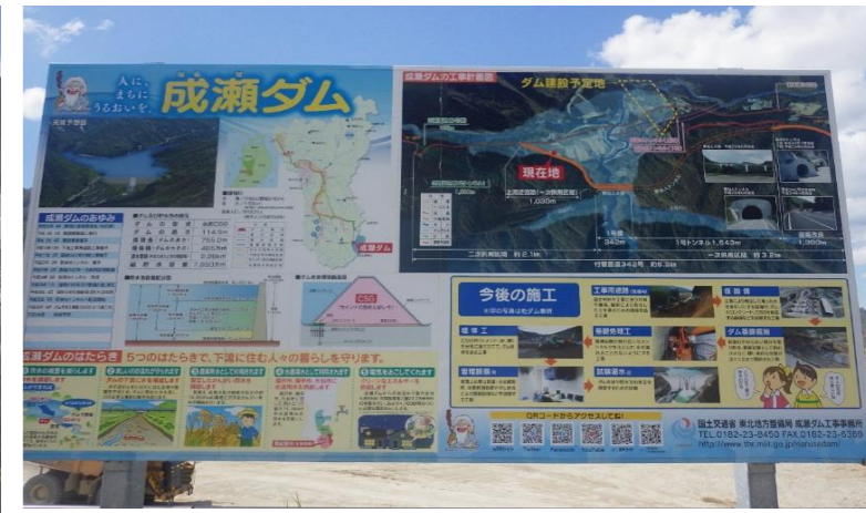
● 成瀬ダム展望駐車場にある工事説明看板です。