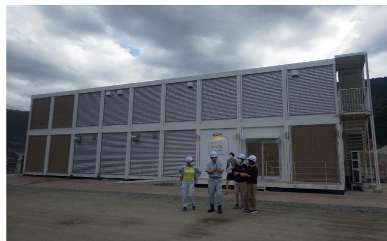
● KAJIMA DX LABOの外観です。2階が無人化重機の操作室になっているそうです。