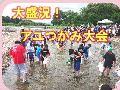
大盛況！ アユつかみ大会

30℃を超える厳しい暑さでしたが、来場者は去年の約2倍となる1600人が訪れ、アユつかみやカヌー体験などを楽しんでいました。