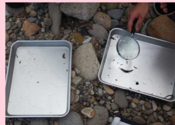
どんな生物がいるかな！？