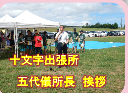
十文字出張所 五代儀所長 挨拶