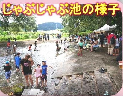
じゃぶじゃぶ池の様子