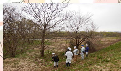
堤防の法面に倒れた木があります。洪水時には障害となるため伐採します。