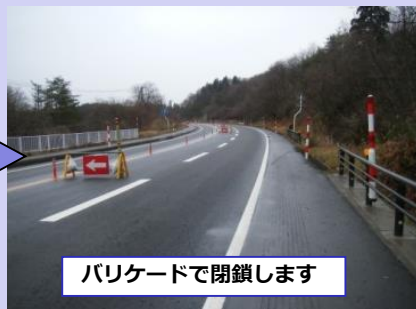
バリケードで閉鎖します