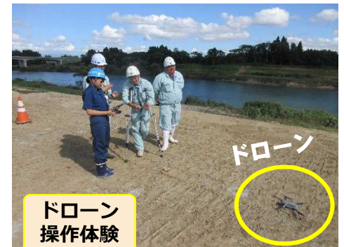
ドローン 操作体験

7月27日(木) 大曲工業高校2年生2名が、大曲国道維持出張所と大曲出張所を訪れ職場体験学習を行いました。実際に現場を目で見て体験することにより迫力などを感じていただけたのではないのでしょうか・・・今回の職場体験を通して未来の建設業の担い手となる生徒の皆さんに建設業界を選ぶ際の参考になってもらえればと思います。