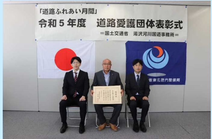
秋田県仙北郡美郷町金沢字下館124 (道の駅美郷)