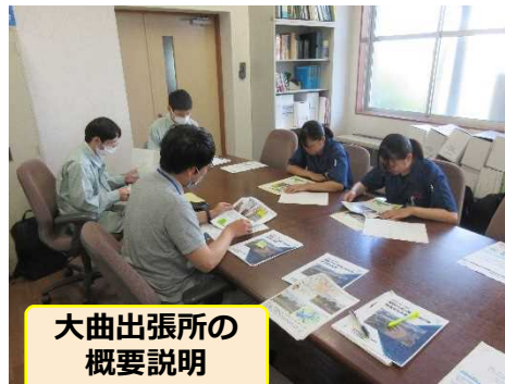
大曲出張所の 概要説明