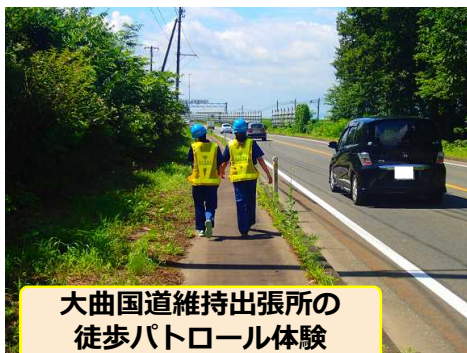
大曲国道維持出張所の 徒歩パトロール体験