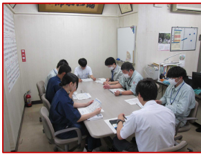
道路管理の概要説明