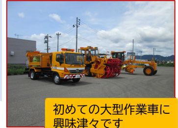
初めての大型作業車に興味津々です

参加された生徒さんにはより一層興味をもっていただき、職業選択の一つになれば幸いです。関係機関の皆様、ご協力いただき大変ありがとうございました。