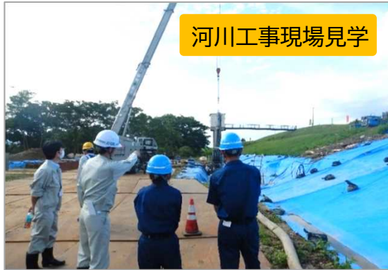
河川工事現場見学