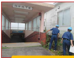
道路パトロール・徒歩巡回 細かいところまでしっかり点検