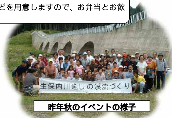
昨年秋のイベントの様子