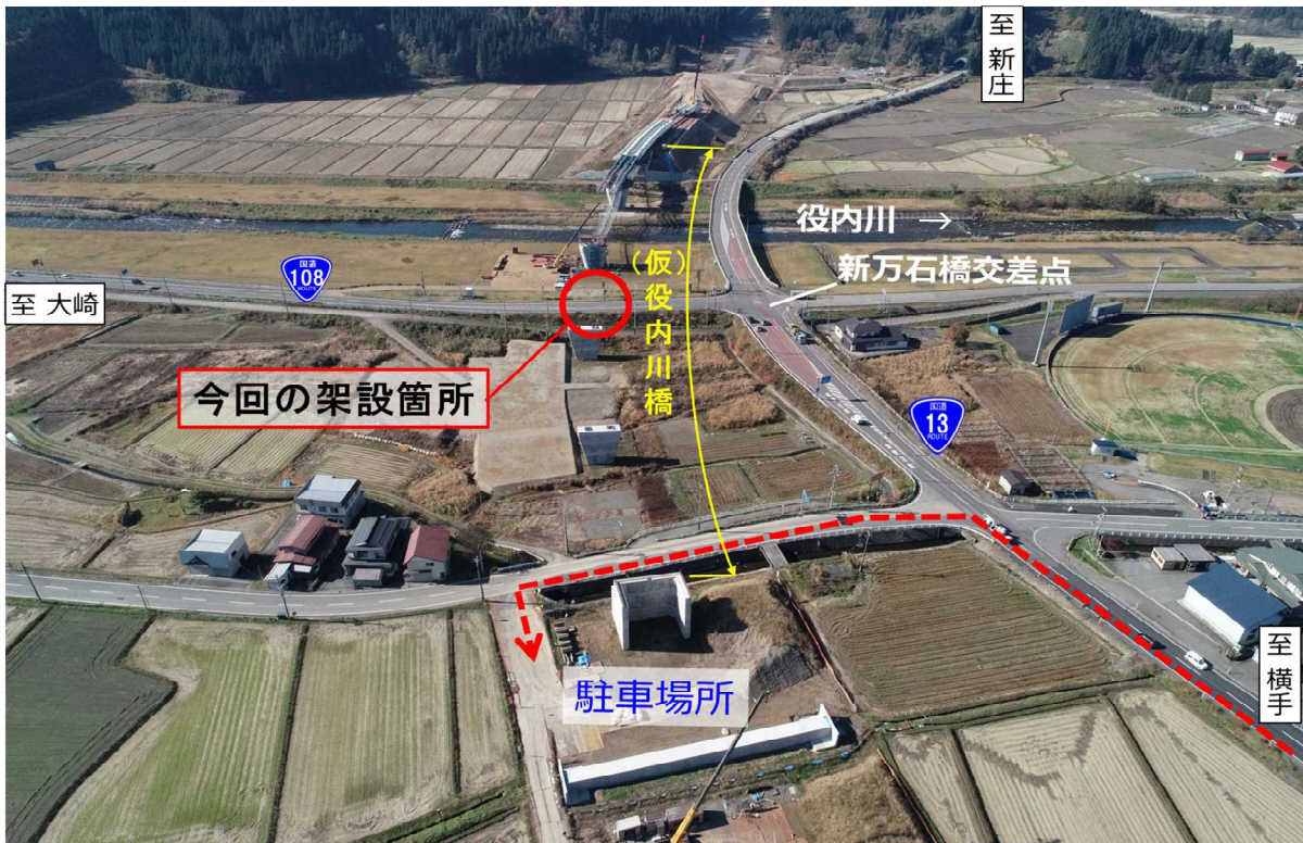
架設作業イメージ図