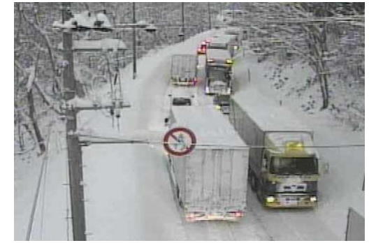
【写②】R3.12.28 国道7号の交通混雑状況