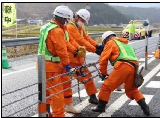
ワイヤーロープ脱着訓練