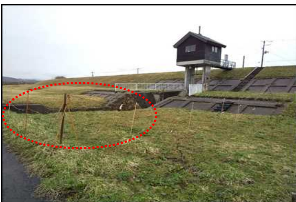
●立入禁止ロープが損傷