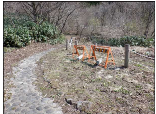
○補修までの間バリケードを設置しました