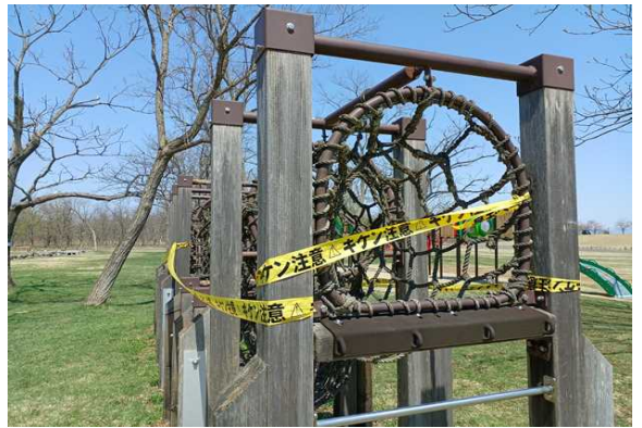
○テープを貼り直しました