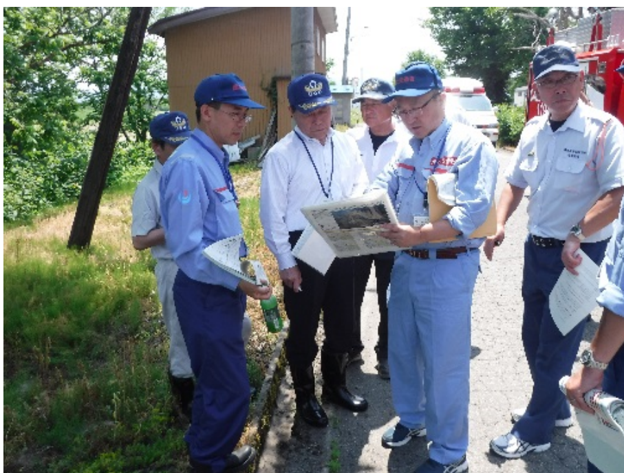
【雄勝地区】 浦田羽後町副町長(中央)との共同点検の様子