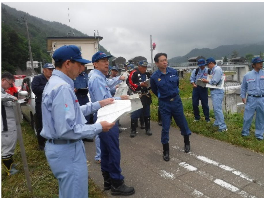
【平鹿地区】 高橋横手市長（中央）との共同点検の様子