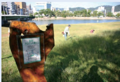
市民団体による看板設置事例 (太田川)

これらの河川法上の許可等について、河川管理者との協議の成立をもって足りることとなります。