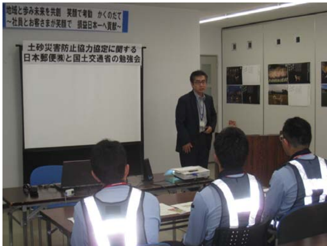
▲開催に先立っての挨拶