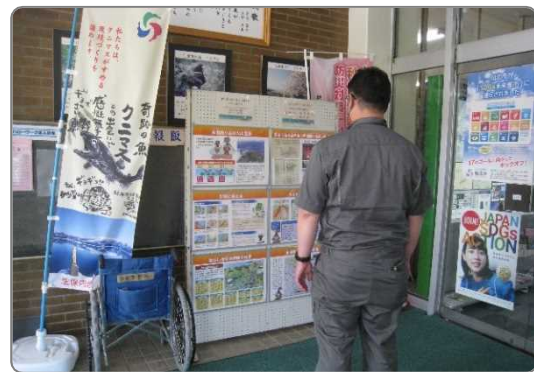
仙北市役所 田沢湖庁舎

秋田駒ヶ岳山系砂防出張所では、6月の土砂災害防止月間中、JR田沢湖駅と仙北市役所田沢湖庁舎で、砂防事業に関するパネル展示を行いました。これは、地域の皆様に、地元で行われている砂防事業をご覧いただけるよう、月間の広報活動の一環として毎年実施しているものです。