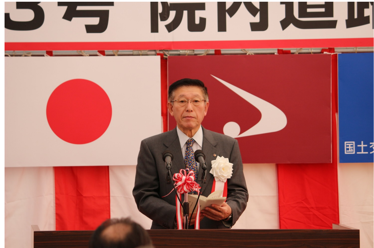
▲はじめに、佐竹秋田県知事が挨拶