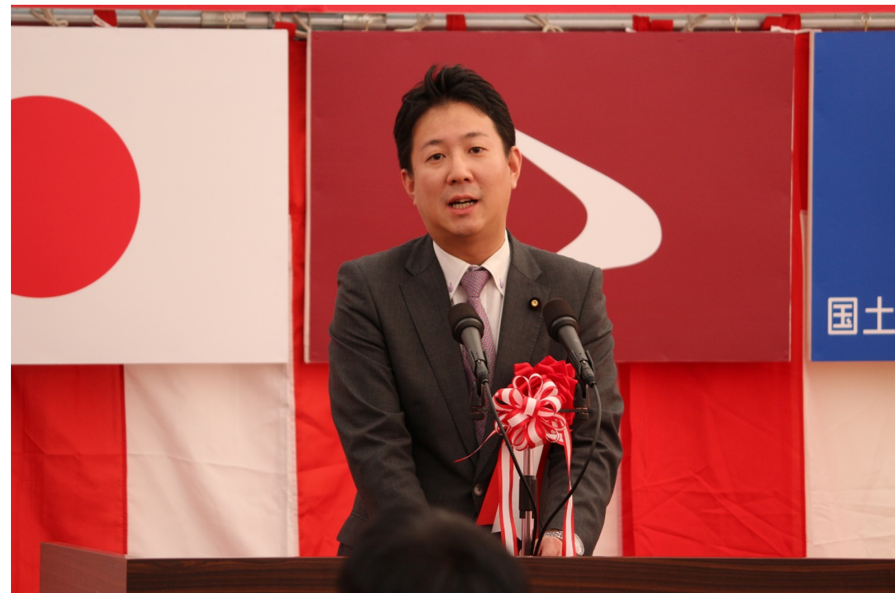
▲来賓祝辞の最後は、中泉参議院議員です