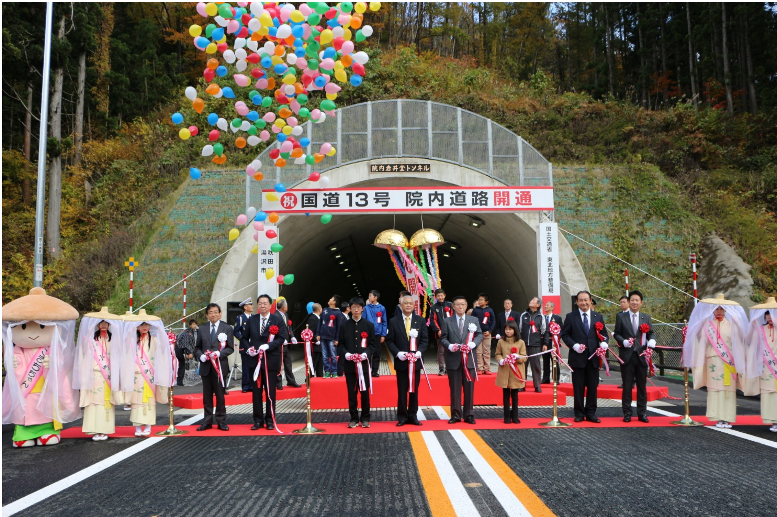
▲テープカット、くす玉、バルーンが同時に！ 「祝、院内道路開通！」