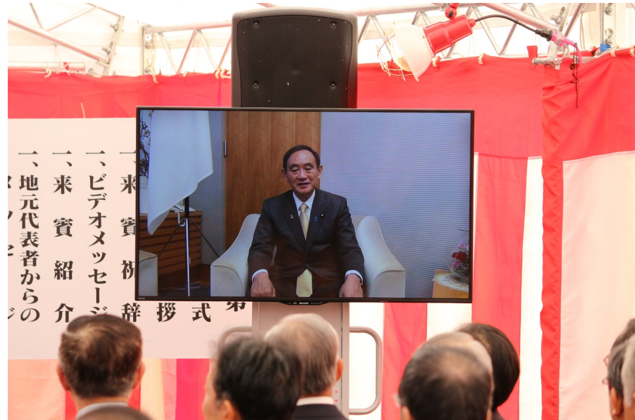
▲ビデオメッセージ：菅内閣官房長官、県境部の事業化に心強い言葉を頂戴