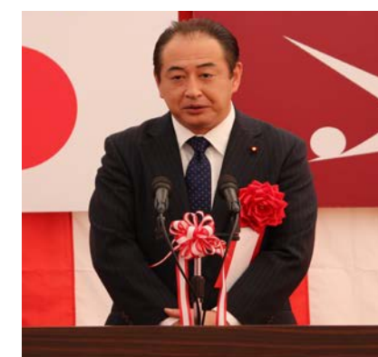
▲御法川衆議院議員