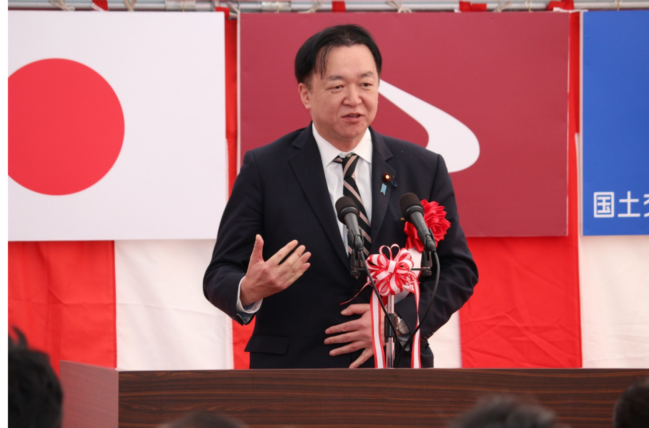
▲来賓祝辞の2人目は、村岡衆議院議員