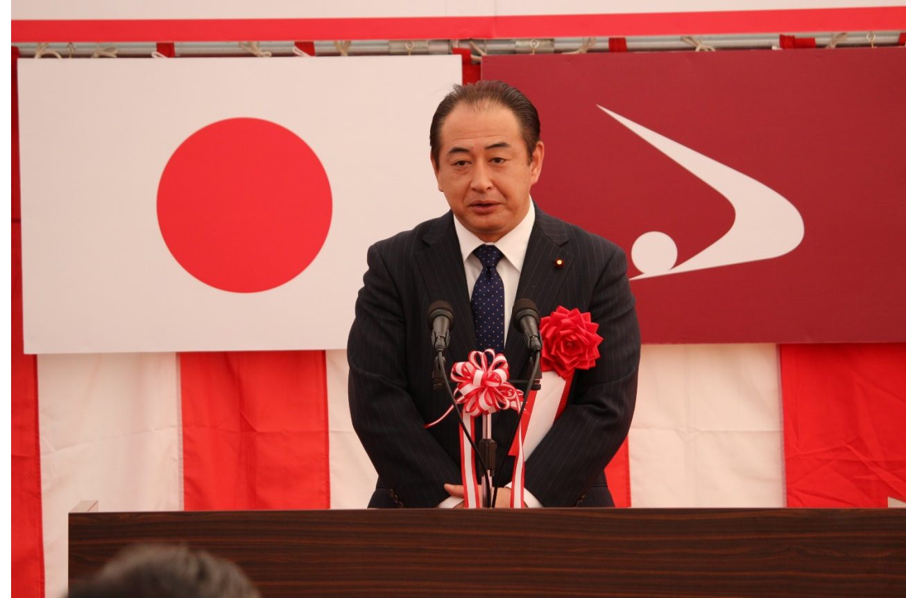
▲挨拶に続き、来賓祝辞の1人目は御法川衆議院議員