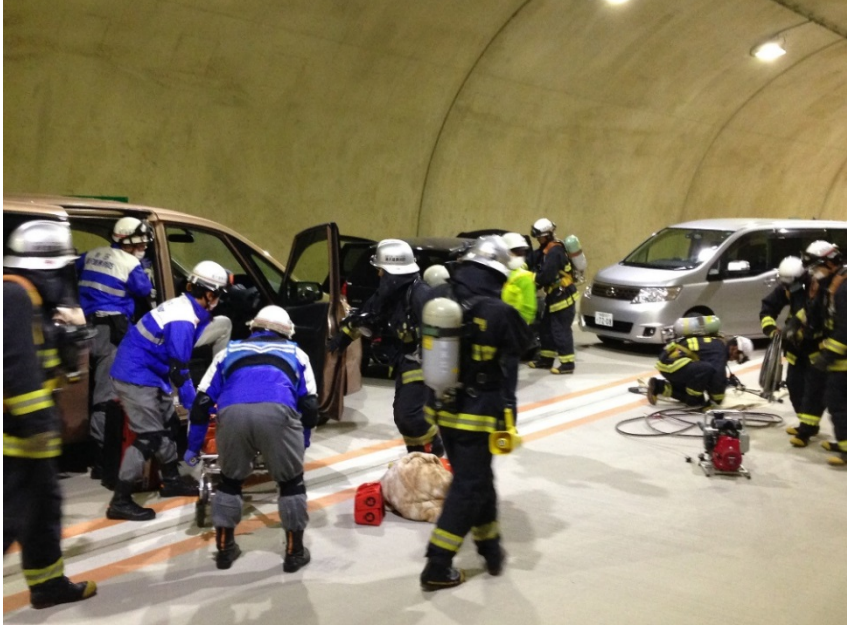
▲巻揚器対策の訓練も興味津々