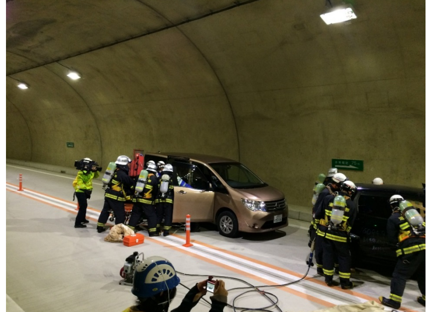
▲建設機械・除雪機械等の展示と搭乗体験