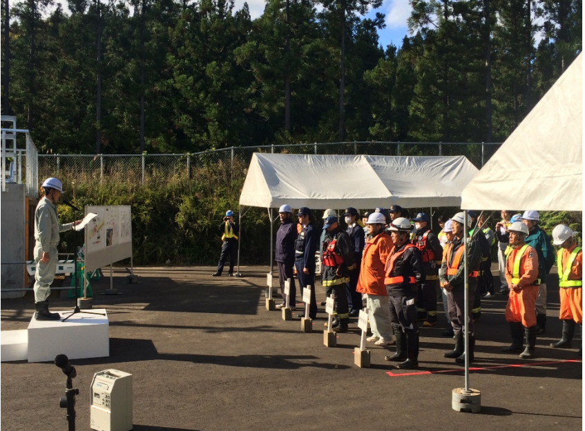
▲訓練手順等の説明