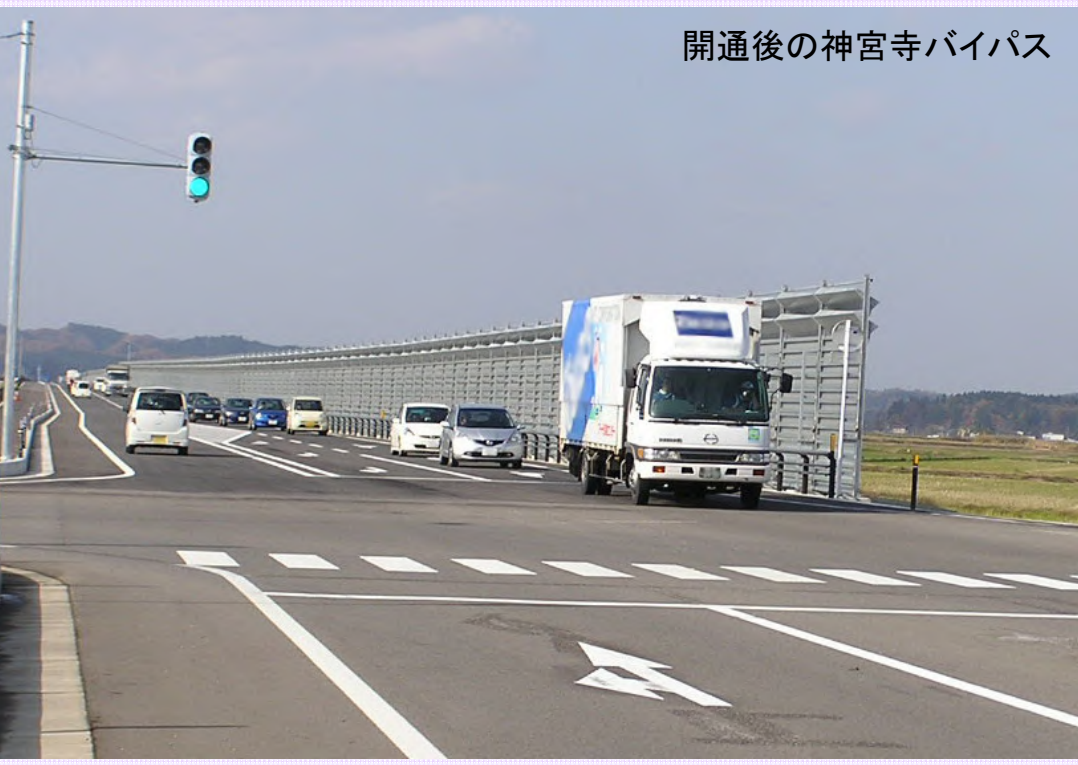
開通後の神宮寺バイパス