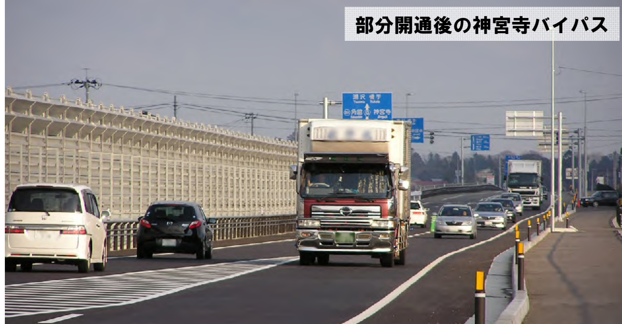
部分開通後の神宮寺バイパス