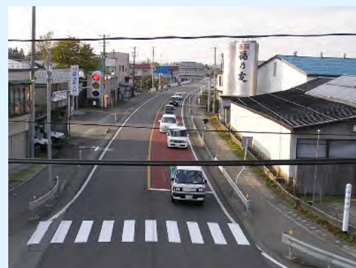
渋滞長調査日: 開通前H14.11、開通後H21.11