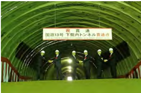
最後に記念撮影を行いました。