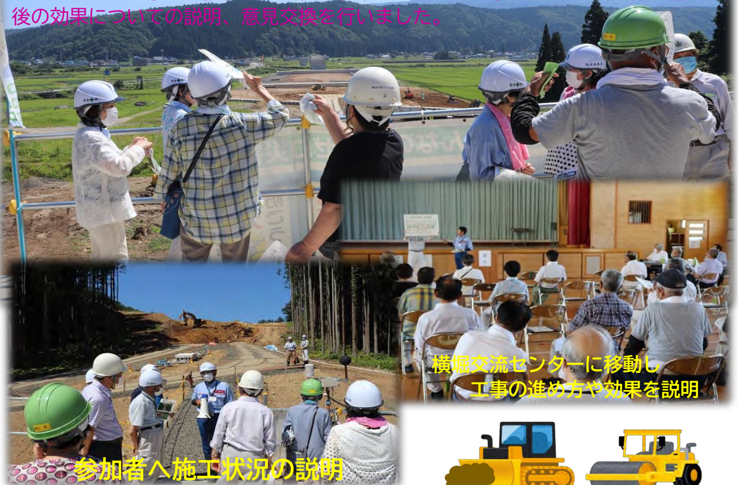
横堀交流センターに移動し 工事の進め方や効果を説明

見学会には約36名が参加し、道路改良工事の建設現場を視察し、その後横堀交流センターで工事の進捗状況や今後の橋梁やトンネル工事の進め方、横堀道路開通後の効果についての説明、意見交換を行いました。