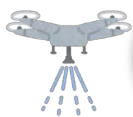
ドローン模擬飛行